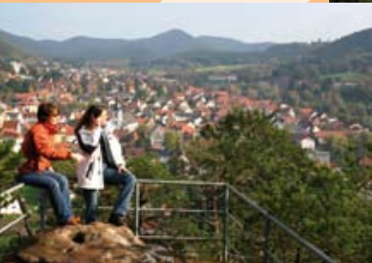
Schwalbenfelsen über Dahn