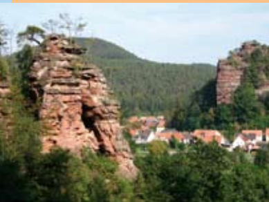
Schillerfelsen mit Jungfernsprung