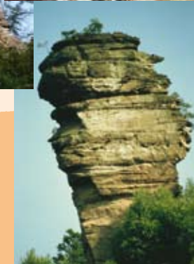
Theoturm am Lämmerfels