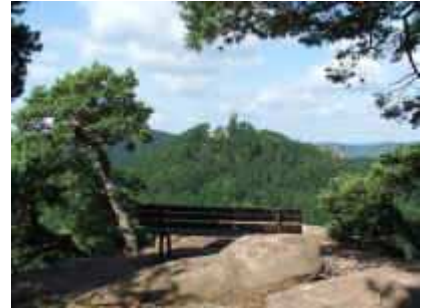
Ruine Scharfenberg (Münz) vom Föhrlenbergfelsen (Slevogtfelsen)