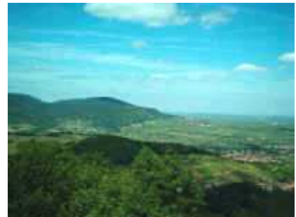
Von Neukastell zur Weinstraße