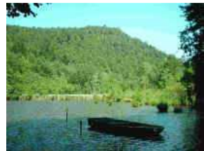
Der Frauenwoog in der Nähe des Seehofes