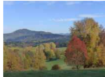
Auf dem Weg zum Flugplatz Söller: Blick zum Jüngstberg