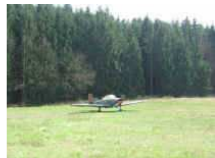
Der Fotobeweis: Es gibt einen Flugplatz auf dem Söller bei Bundenthal