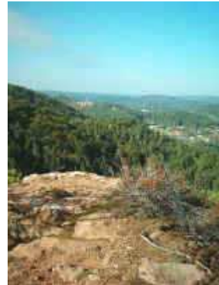
Vom Rauberg nach Erfweiler und zur Burgruine Altdahn