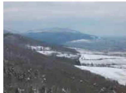
Von der Madenburg nach Norden zur Weinstraße