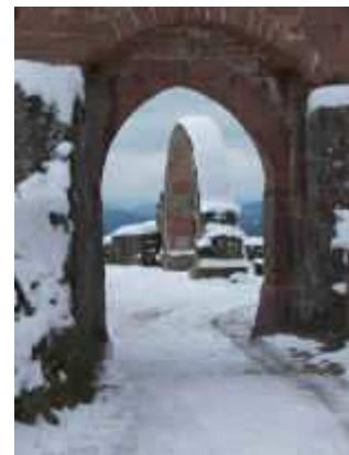
Das Eingangstor zur Oberburg der Madenburg