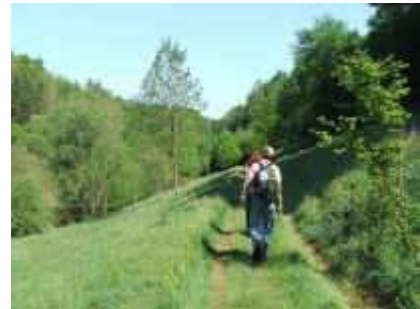
Im Vinninger Tal