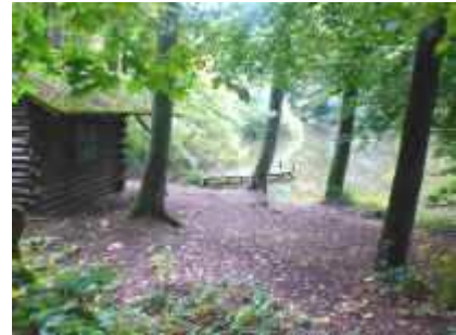
Gersbachtalweiher unter dem Teufelsfelsen