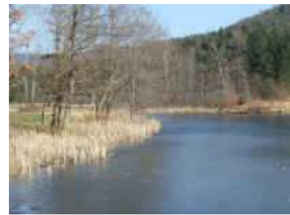
Am Klosterweiher im Spießwoog-Tal