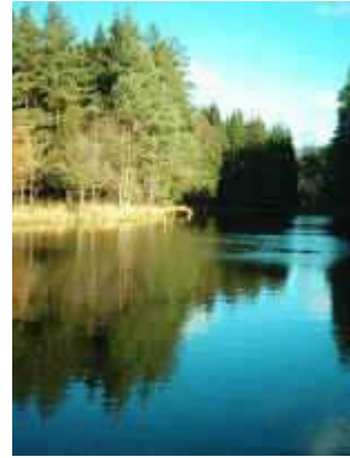
Im Schlettenbacher Tal