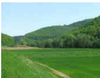
Alsenztal bei Rockenhausen

Barbarossa-Radweg und Pfälzer-Land-Radweg in Enkenbach-Alsenborn